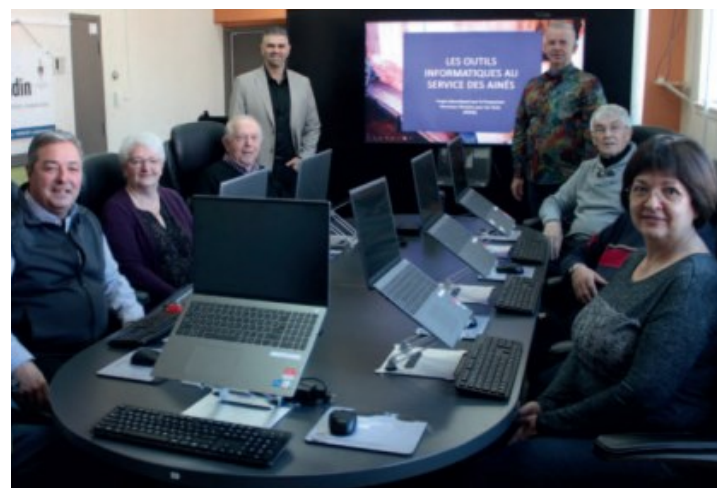
Sur la photographie: le député Joël Godin en compagnie des intervenants du projet.