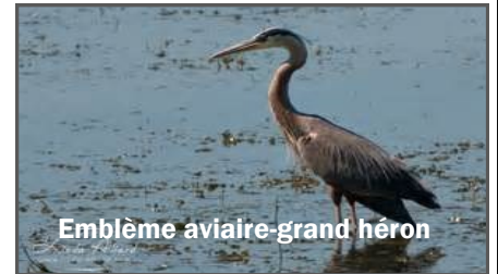
Emblème aviaire-grand héron

À titre de présidente du comité d'embellissement, c'est avec plaisir et enthousiasme que je me permets aujourd'hui de vous faire un petit résumé des réalisations effectuées par le comité d'embellissement au cours des trois (3) dernières années.