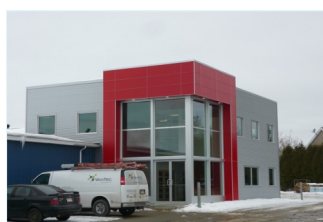
Nouveaux bureaux administratifs construits en 2013