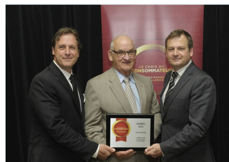
Gagnant « Choix du Consommateur 2013 »