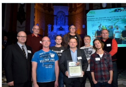
Gagnant du « Grand Prix CSST » catégorie Innovation (2013)