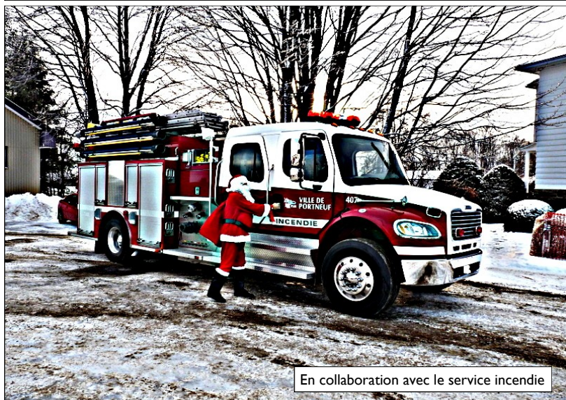
En collaboration avec le service incendie