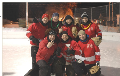
Gagnants Fête de l'hiver 2013.

LA FÊTE DE L'HIVER À PORTNEUF 5e ÉDITION SAMEDI le 8 FÉVRIER 2014 C'EST LE MOMENT DE S'INSCRIRE AU TOURNOI DE BASEBALL SUR GLACE: Infos: 418 286-3844 #28 ou loisirs@villedeportneuf.com (dépôt de 20.00$ par équipe à l'inscription).